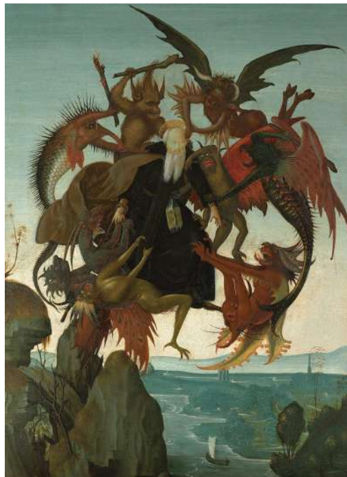
Il Tormento di sant'Antonio dipinto su tavola (47x35 cm), tempera e olio, attribuito al giovane Michelangelo Buonarroti e proveniente dalla bottega di Domenico Ghirlandaio. (1487/1489), Kimbell Art Museum

La figura di sant'Antonio attraversa i millenni della fede e della vita cristiana. Nato in Egitto intorno al 250 d.C., la sua vicenda ci è giunta soprattutto attraverso la Vita di Antonio , la più antica testimonianza a lui dedicata, scritta da Atanasio, vescovo di Alessandria. Dopo la morte del santo, avvenuta nel 356, il suo culto si diffuse rapidamente, prima in Oriente e poi in Occidente, tanto che Antonio venne presto riconosciuto come "il Grande". La sua vita mostra che, ancora giovane e rimasto orfano, si trovò a custodire un patrimonio familiare considerevole e a prendersi cura della sorella. Ma un giorno qualcosa ridisegnò per sempre la sua storia. Entrato in chiesa, ascoltò il Vangelo: «Va', vendi quello che hai e dallo ai poveri». Quella parola lo toccò nel profondo. Vendette