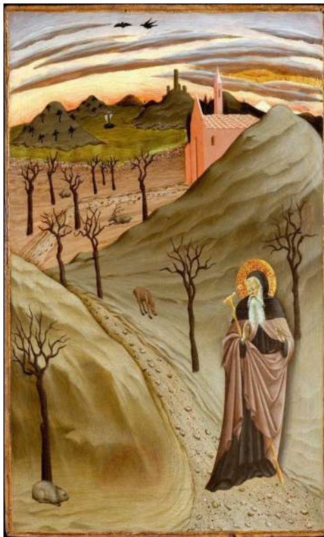
Maestro dell'Osservanza, sant'Antonio Abate nel deserto (47x33,7 cm), ca. 1440 New York Metropolitan

immagini per spaventare e turbare.» E dietro questa espressione si riconosce l'esperienza universale dei pensieri che arrivano all'improvviso, che ingrandiscono paure, che spingono fuori strada. Per questo la fede, nella prospettiva di Antonio, assume un valore dirimente per la vita di ciascuno di noi: «La fede è un muro di difesa.» Un muro che protegge e permette di restare vigilanti e il vegliare sui nostri pensieri si trasforma in un'anima quieta, e una vita senza paura, che nel tempo «acquista la carità, la mitezza, la fede.» La lotta dei pensieri, vissuta con continuità e tenacia, ha reso Antonio, racconta La Vita , uomo equilibrato, capace di pace e vicino alle persone. Chi lo incontrava trovava qualcuno che sapeva ascoltare, sostenere e ricomporre le divisioni. Lavorava con le proprie mani e condivideva i frutti del proprio lavoro con i poveri. La sua attenzione agli altri nasceva da uno sguardo capace di riconoscere il bene e di farlo crescere. In questo senso, la sua bontà rappresenta il risultato concreto della lotta interiore in una fede custodita giorno dopo giorno, capace di dare forma a una vita, che resiste e genera bene. Così la lotta dei pensieri vissuta con coerenza, può divenire anche per noi il luogo in cui la vita si trasforma. È lì che si impara a scegliere, a resistere, a restare. È lì che il coraggio diventa azione e la tenacia si trasforma in cammino, corsa, giubilo, allegria, che caccia via ogni paura!