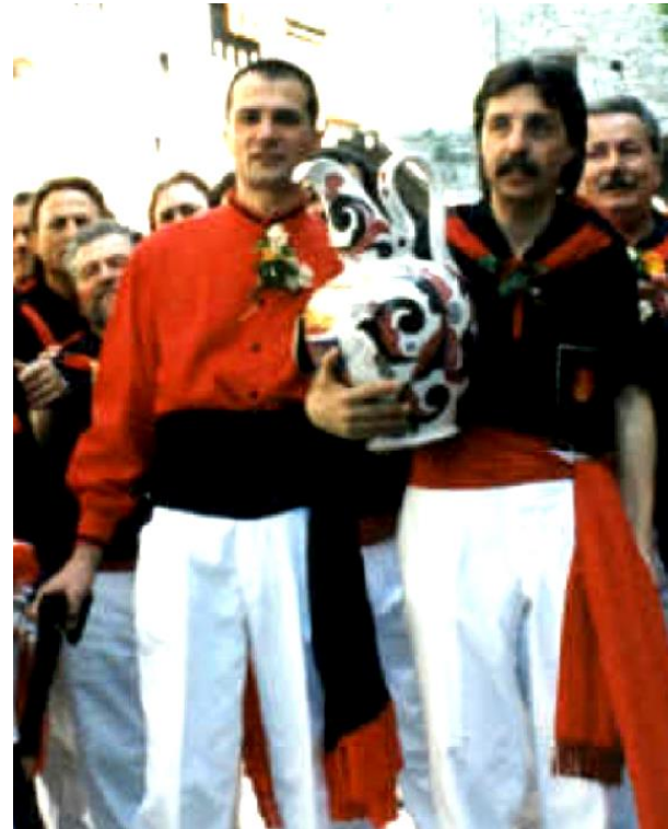
1993 – 1995 – 1997 Alfredo Minelli Zenga