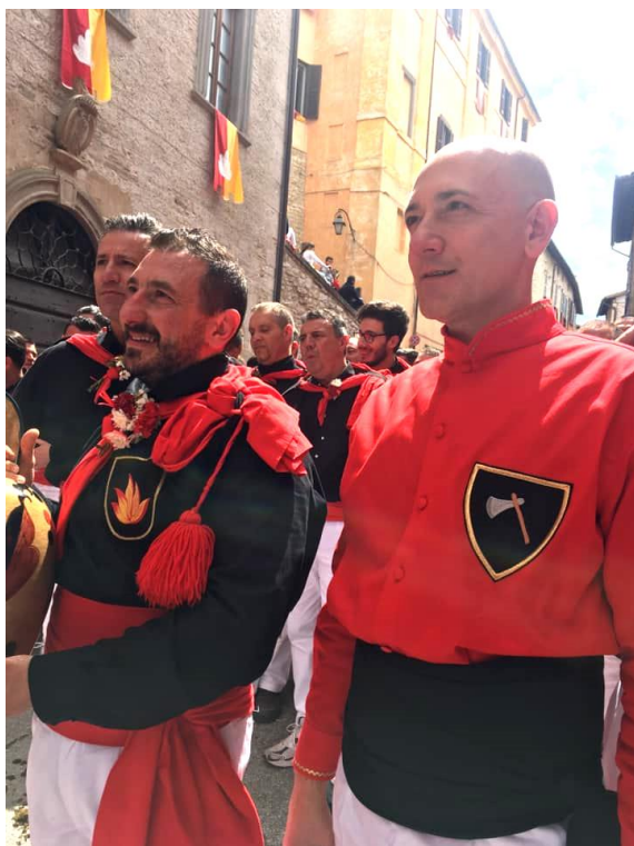
2019 Moreno Morena Moro